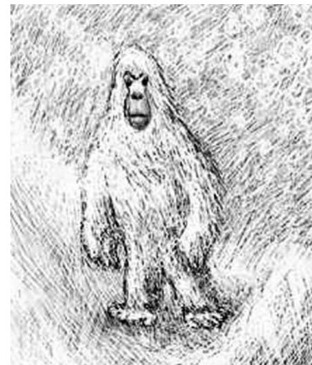
Абстрактный рисунок снежного человека.

Большинство видевших хозяина утверждают, что видели мужчину.