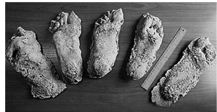
Отпечатки следов, найденных в Архангельской области у деревни Шотогорка. Это примерно 48-й размер

Ведь я ничего раньше не знал про это существо и про него не слышал. Просто, разглядывая следы, мы порассуждали о том, что какой же должен быть медведь-гигант, если следы такого чудовищного размера?!