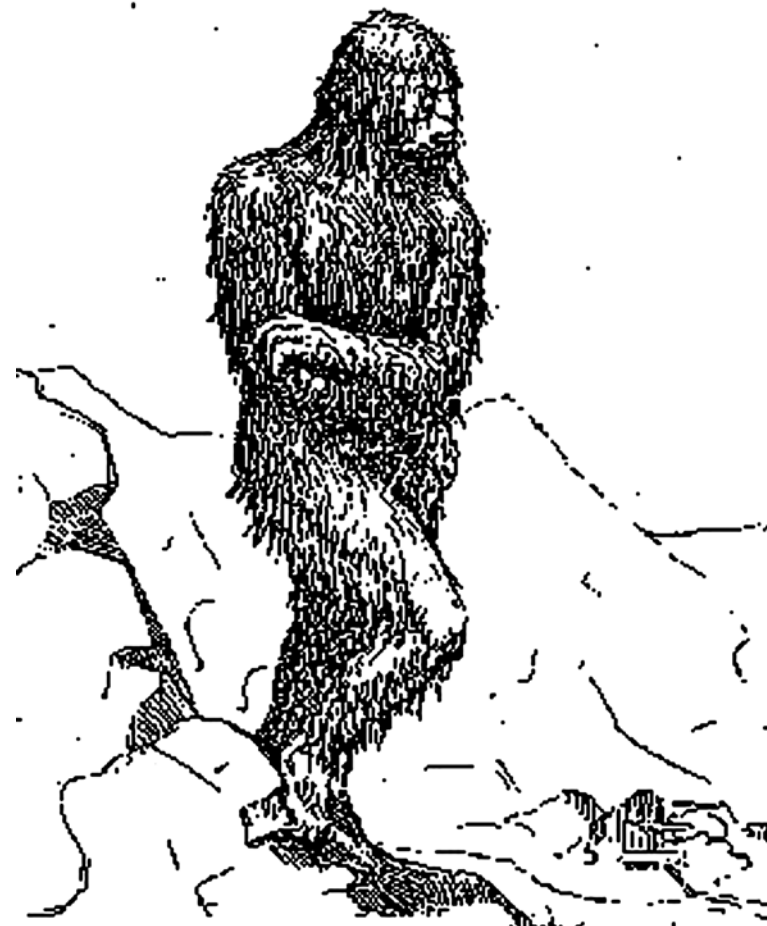
Рисунок Н. Ф. Гончарова