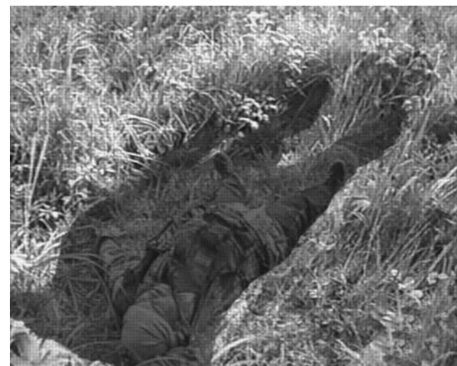
ТОТ на месте лежбища снежного человека