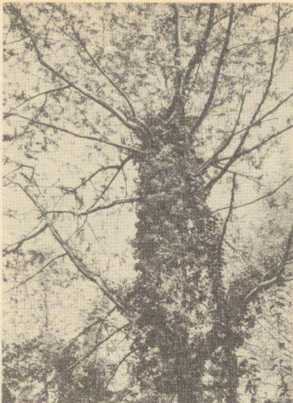
Рис. 26. В кавказской лапине угнездился енот-полоскун. 1946 г.

Солнечный тихий день конца сентября, обилие диких и одичавших фруктов, лесных и грецких орехов, шумные взлеты фазанов создавали прекрасное настроение. Под вечер я облюбовал для отдыха и ночевки опушку небольшой сухой поляны и, соорудив косою навес из полотнища легкого полубрезента на случай дождя и постель из ветвей, развел костерок. После легкого ужина я потушил огонь и улегся. В сумерках меня охватило неясное беспокойство как бы от пристального взгляда. Поэтому двадцатку,