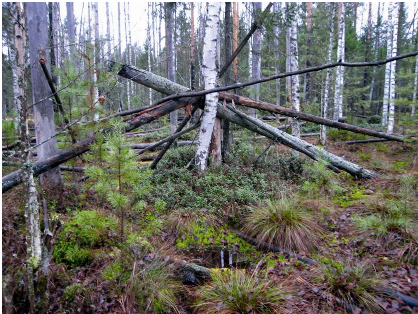
Строение на Вятке.