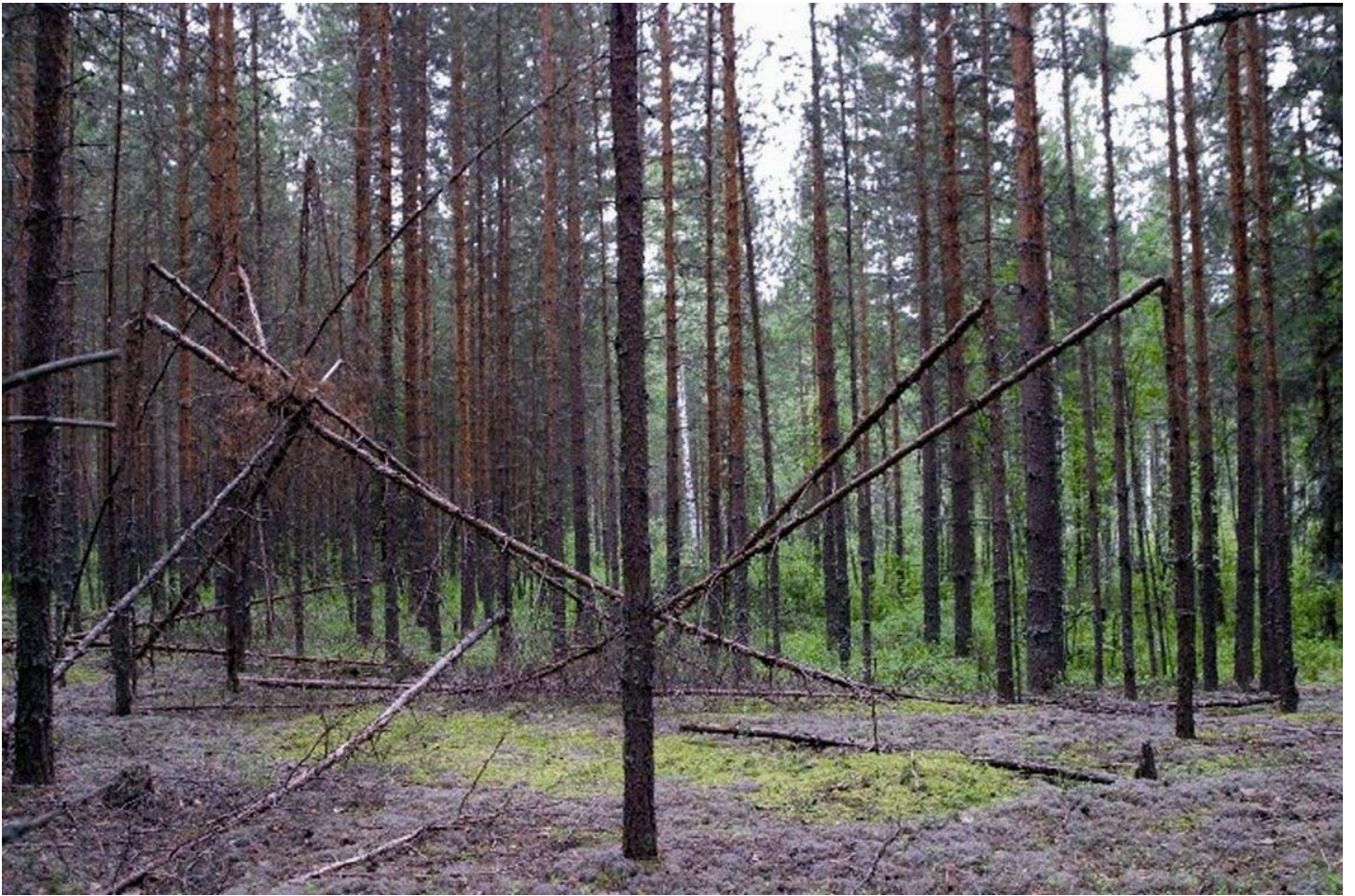
Древесные строения в Кировской обл. 2003 г., фото Анатолия Фокина