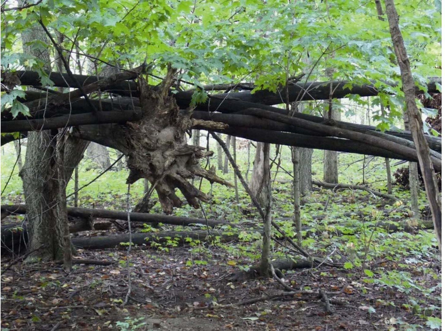
Похожее строение сфотографировано в США