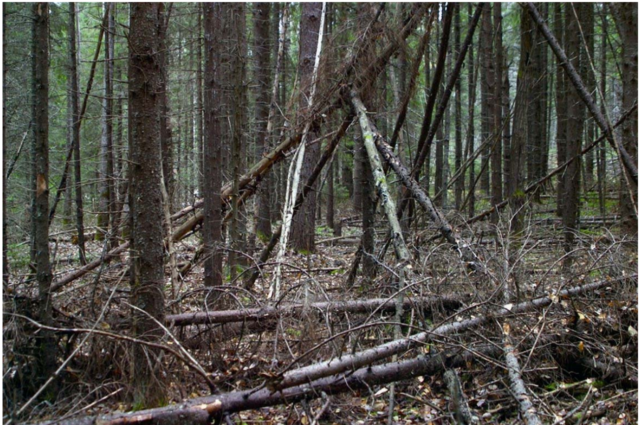
Строение лешего, на Вятке. А. Фокин, 2008 г.