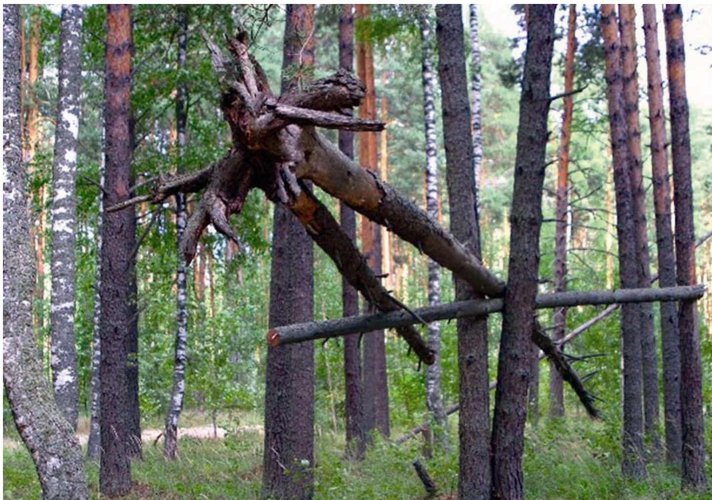
Лесное строение в Кировской области.